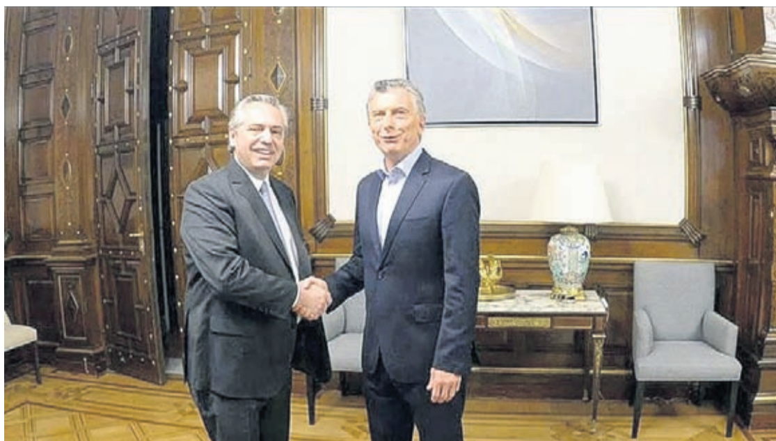
y Cristina Fernández.

E decision a bin di varios reunion entre e hefe di Gabinete actual, Marcos Peña, di parti di oficialismo y Santiago Cafiero, homber fuerte rond di Fernandez, cu lo ricibi finalmente e baston presidencial na sede di e Legislativo, manera su deseo ta. Siguiendo e pasonan di Néstor Kirchner